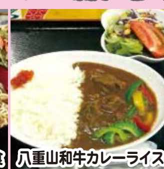
八重山和牛カレーライス