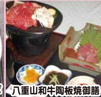
八重山和牛陶板焼御膳